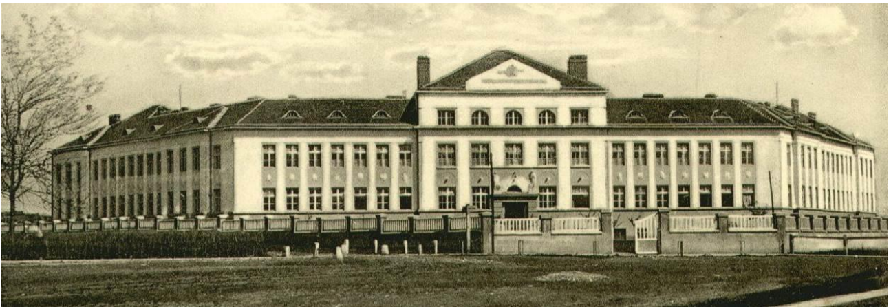
Слика 1. Женска учитељска школа -изглед из 1926. године